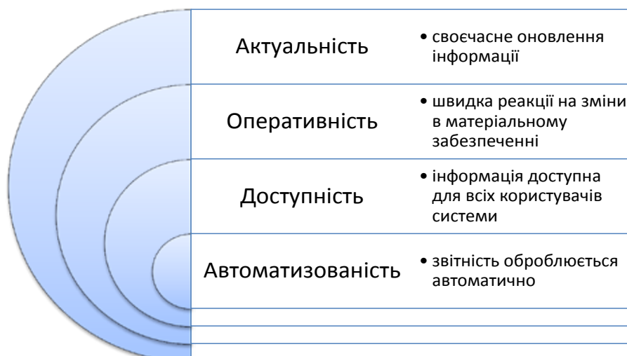
Рис. 2. Принципи інформаційного забезпечення, які повинні використовуватися під час дослідження фінансово-економічних показників

Принципи інформаційного забезпечення такого аналізу фінансово-економічних показників відображено на рис. 2.