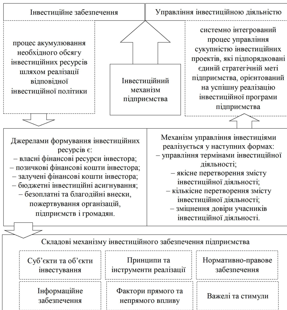
Рис. 2. Концептуалізація окремих складових в контексті розробки інвестиційного механізму підприємства