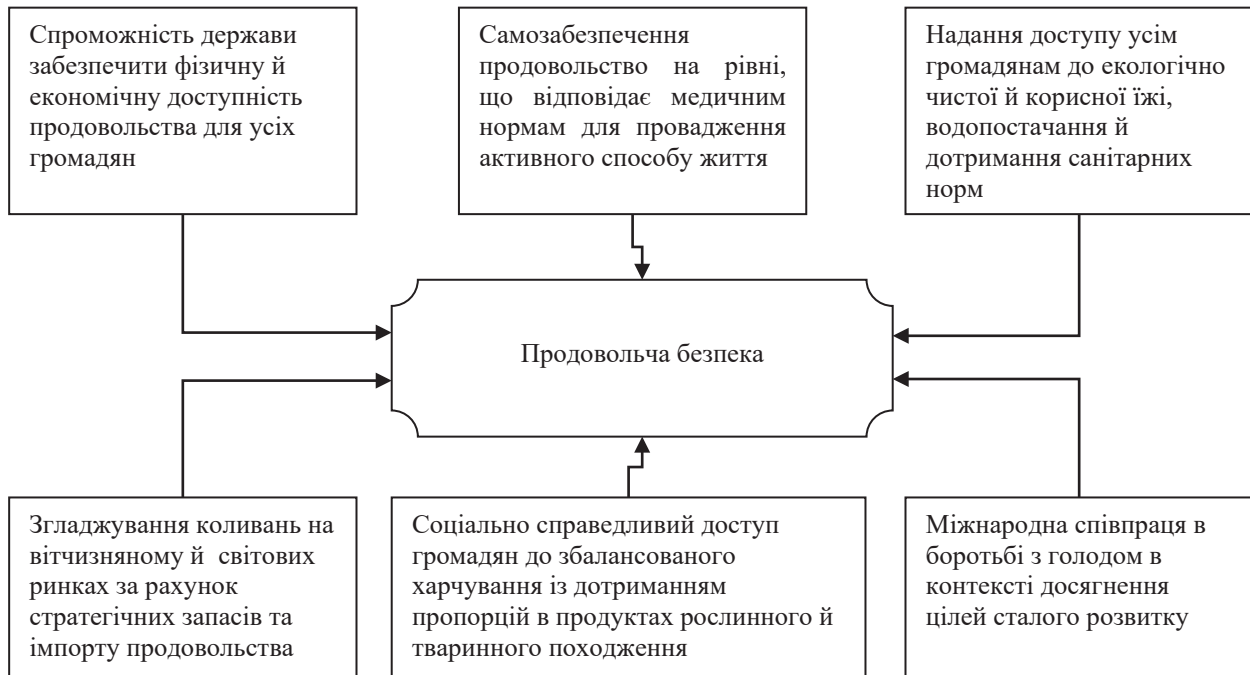
Рис. 2. Ключові аспекти ієрархичності забезпечення продовольчої безпеки